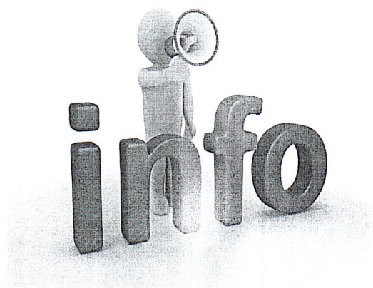
ГРАФИК ДОПОЛНИТЕЛЬНЫХ ЗАНЯТИЙ И ИНДИВИДУАЛЬНЫХ КОНСУЛЬТАЦИЙ ПО ПОДГОТОВКЕ К ЕГЭ - 2025